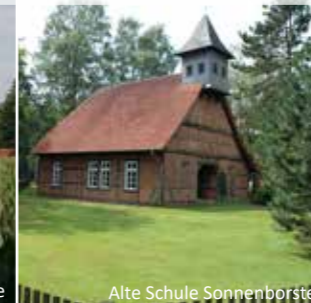
Alte Schule Sonnenborstel